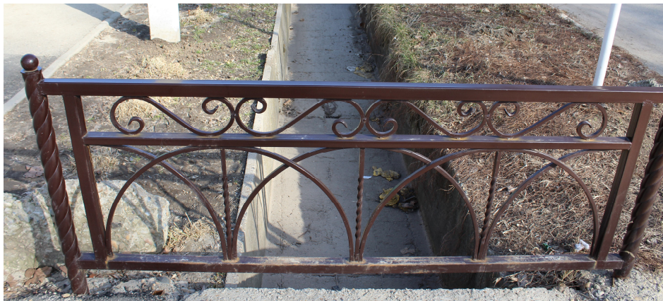
ВАРИАНТ ОГРАЖДЕНИЯ ПЕШЕХОДНОГО МОСТИКА